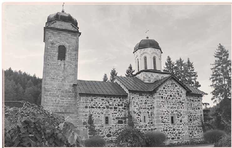
Monaster Ozren pw. św. Mikołaja

W niewysokich górach Ozren, rozciągających się na południowy wschód od Doboju, włączonych w granicę Republiki Serbskiej, w kotlinie otoczonej zalesionymi górami